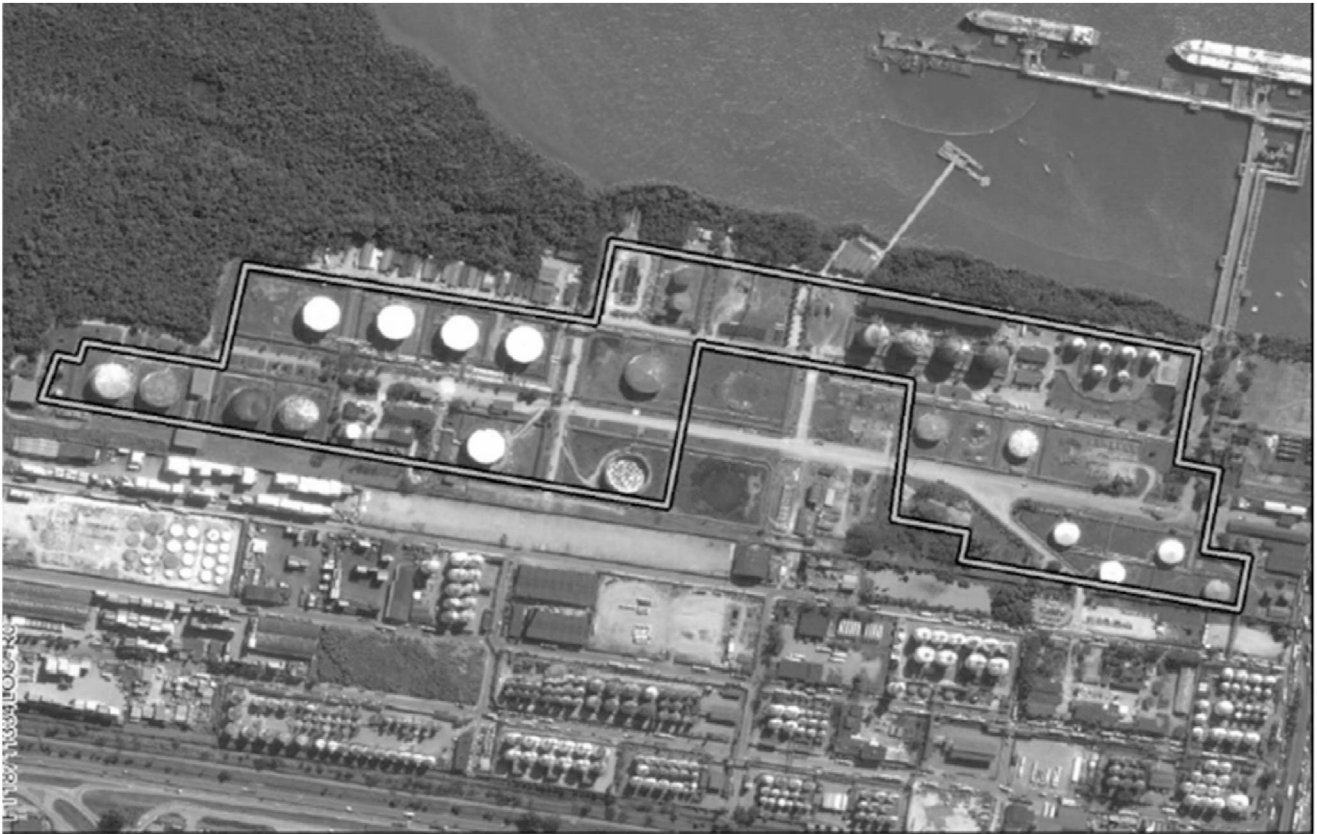
Figura 2: Delimitação aproximada da área atualmente arrendada à Transpetro

Com relação à verificação in loco na área STS08 e às entrevistas, realizadas nos dias 16 e 17/10/2019, as informações foram compiladas, analisadas e apresentadas nos tópicos a seguir, a qual sintetiza as informações relevantes para a definição do diagnóstico preliminar da área: