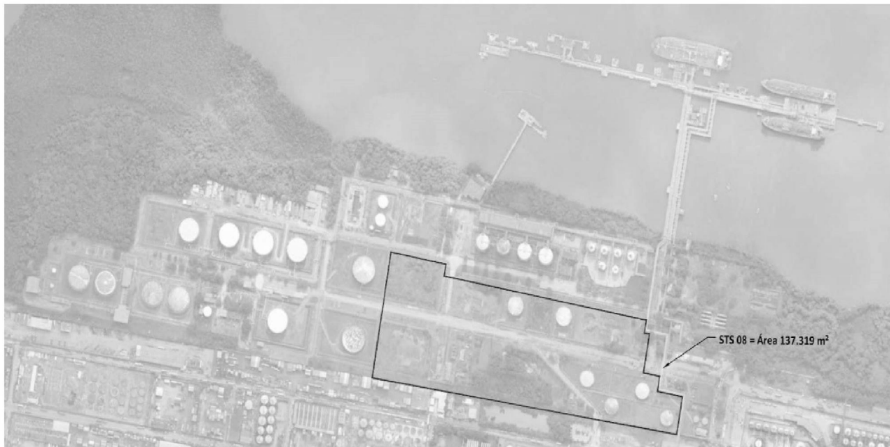
Figura 1: Localização da área do Terminal STS08

ampliação de estruturas e equipamentos, de forma a viabilizar o incremento da capacidade de armazenamento e movimentação. A Seção C – Engenharia detalha as premissas consideradas para a futura recomposição do Terminal pelo vencedor da licitação.